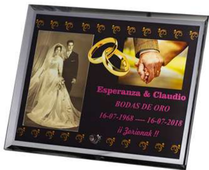
1340-0 18 x 24 cm. Acepta impresión digital.