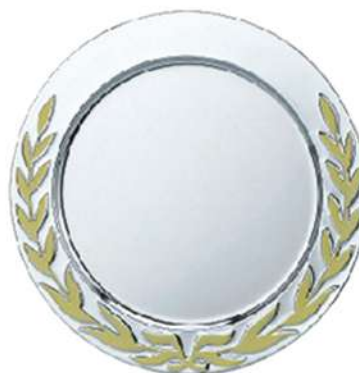
Plato Laurel con Dorado

PD312PLO 12.5 cm Ø. PD313PLO 15 cm Ø. PD314PLO 20 cm Ø. Plato de metal color plata con hojas doradas.