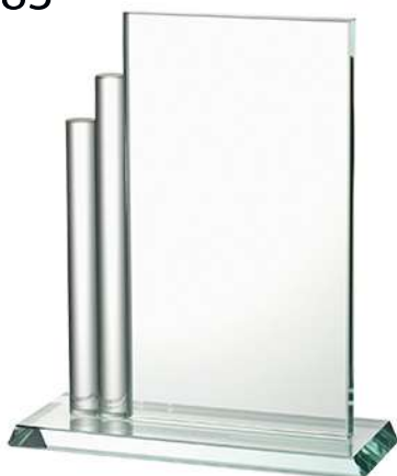
W483 23.5 x 14.5 cm.