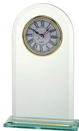
W540 20 x 10 cm.